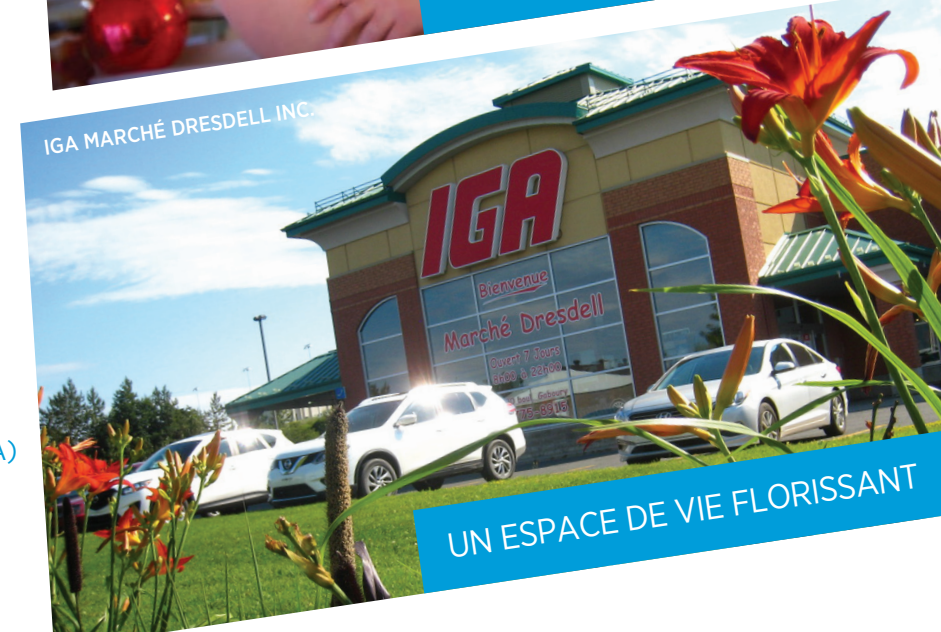
IGA MARCHÉ DRESDÉLL INC.