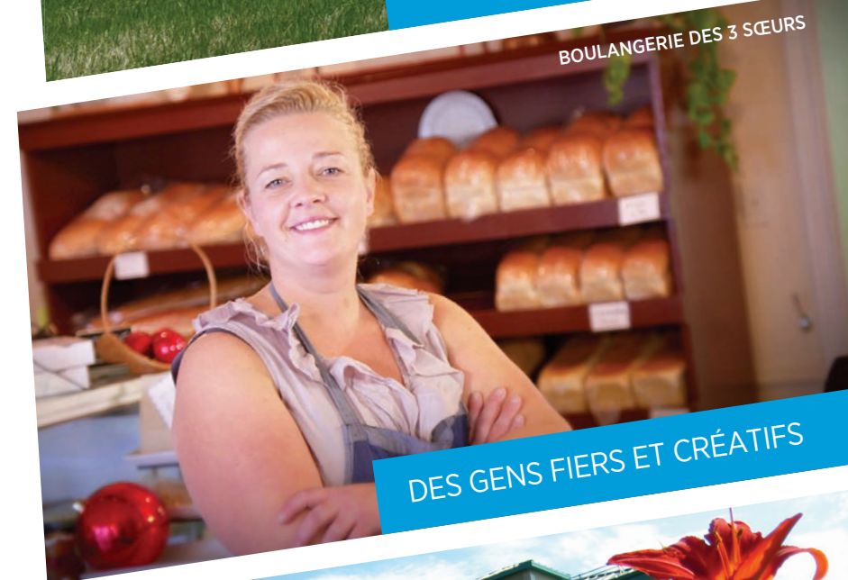
BOULANGERIE DES 3 SŒURS