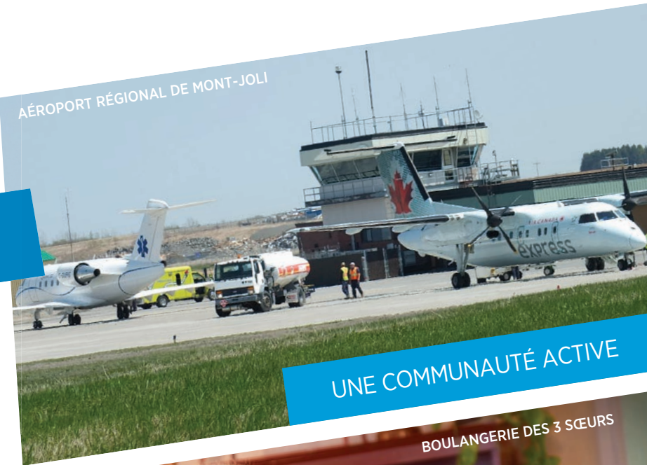
AÉROPORT RÉGIONAL DE MONT-JOLI

15 550 voitures transitent chaque jour sur une moyenne annuelle (DJMA) au carrefour giratoire. C'est une augmentation de 15 % depuis son ouverture en 2009.