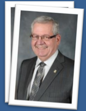
Georges Jalbert District 3

Tel que prévu au programme des immobilisations, des équipements de déneigement ont été acquis et complètent le camion 10 roues acheté l'an dernier. J'attire également à votre attention l'achat d'une benne à asphalte isolée. Ces équipements permettront de maintenir un très bon niveau de qualité quant à nos services aux citoyens.