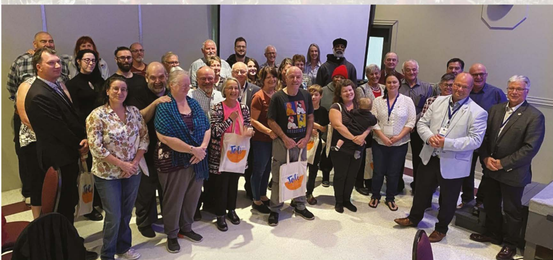
Une quarantaine de personnes ont répondu à l'invitation et participé à l'activité qui s'est déroulée sous forme de 5 à 7, le 22 septembre, au Centre Colombien.

Y sont logés temporairement la mairie, la direction générale, le service des communications, la direction des ressources humaines et de l'urbanisme et le service d'inspection municipale. L'ensemble de ces services regagnera ses quartiers une fois que seront terminés les travaux à l'hôtel de ville, en janvier selon toute probabilité.