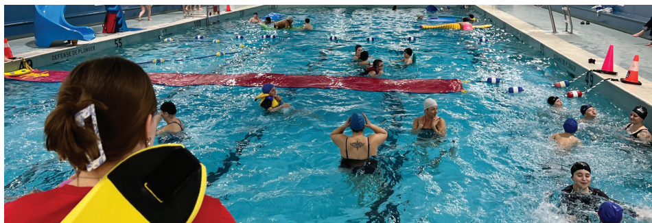
Une nouvelle session de cours débutera le 25 juin à la Piscine Gervais-Rioux.

Autrement, on peut s'inscrire par téléphone au 418 775-7285, poste 2172 ou directement au Service des loisirs, 300, avenue du Sanatorium.