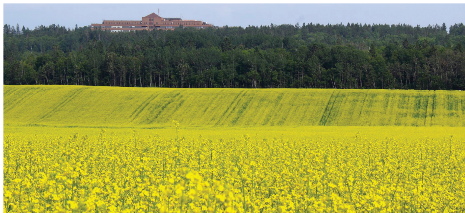
Une des photos primées en 2023 pour le calendrier 2024. Il s'agit d'une photo de M. Nelson Banville.

Le concours est ouvert à tous, amateurs et professionnels.