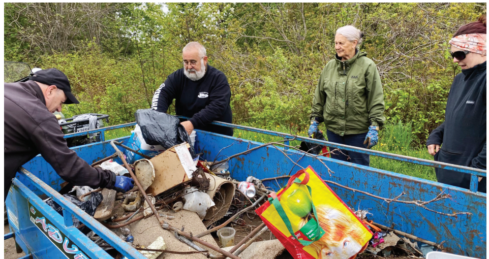
Bon an, mal an, on trouve de tout lors des activités de nettoyage printanier au Parc du ruisseau Lebrun.

Bas-Saint-Laurent et ÉCO Mitis encouragent chacun à apporter sa contribution à la préservation de l'environnement local. Chaque petit geste compte dans la préservation de la beauté de notre environnement.