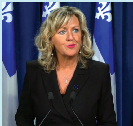
La ministre des Affaires municipales, Andrée Laforest.

Cette initiative vise à favoriser une meilleure démocratie municipale, notamment en vue des élections de 2025, où plus de 1 100 municipalités au Québec devront pourvoir environ 8 000 postes d'élus.