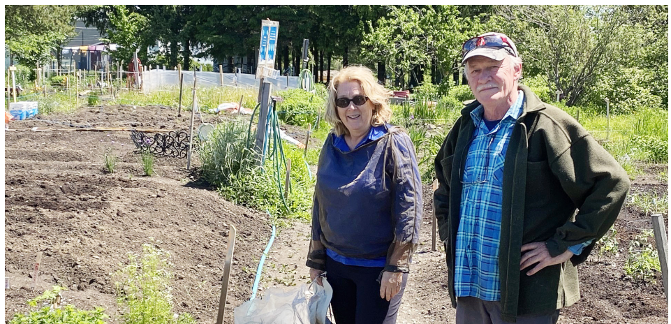
Les citoyennes et citoyens peuvent louer un jardinet dans l'un des deux sites du Petit Plantarium.