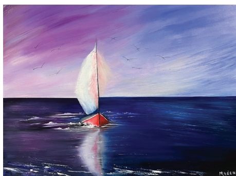
Cette peinture fait partie des œuvres exposées jusqu'au 25 mai dans le hall d'entrée de la Bibliothèque Jean-Louis-Desrosiers.

On peut visiter cette exposition aux heures d'ouverture de la Bibliothèque.