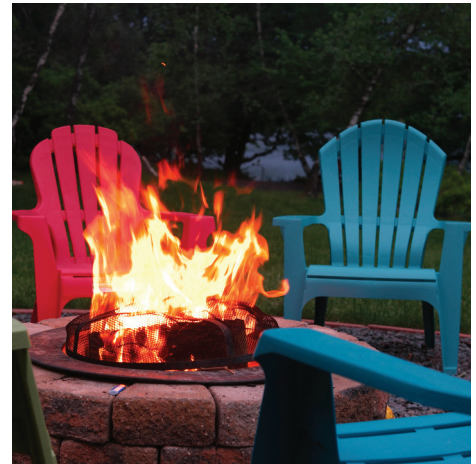
Le retour du beau temps marque aussi le retour des feux extérieurs.

poste 2104 ou consultez le site web sous l'onglet Services aux citoyens, section Sécurité incendie.