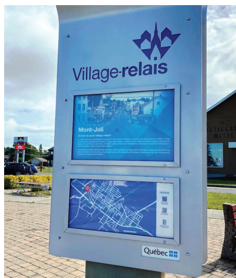
Mont-Joli fait partie du réseau des Villages-relais qui offrent un lieu sûr et sécuritaire pour les visiteurs.

Actuellement, seize régions du Québec bénéficient des services offerts par le réseau des Villages-relais.