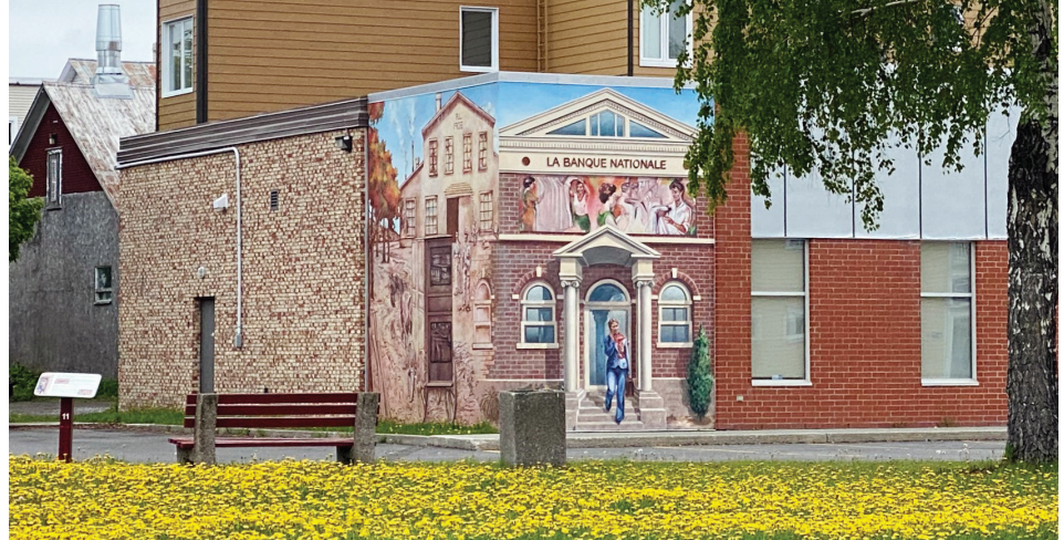
Défi relevé pour ce bel espace situé près de la Bibliothèque Jean-Louis-Desrosiers.

linisateurs. La municipalité elle-même s'engage en laissant une partie de ses espaces verts couverts de ces fleurs.